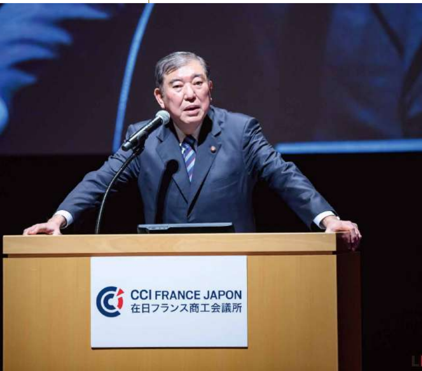
「世界に通用する学びとは？」と題した日仏ビジネスサミットの講演では、日本や世界が抱える課題について言及した

Therefore, it becomes important to strengthen relations with the Middle East, especially with the UAE. I would appreciate it if businesses could keep Japan's national