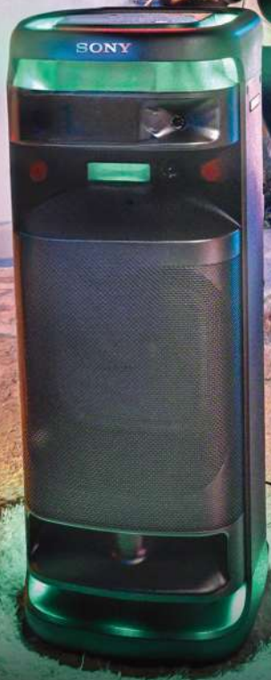
ULT TOWER 10