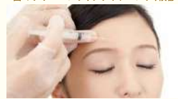
Botox / ボトックス