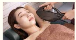
Medical Hair Removal / レーザー医療脱毛