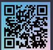
SCAN TO SHOP

Available at all major retailers in the region. UAE Toll Free: 800 7669 (SONY).