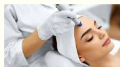
Hydra Facial / ハイドラフェイシャル